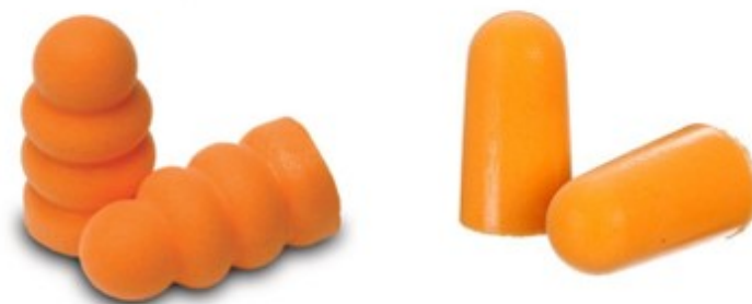
Рис. 3. Вкладыши (беруши)[14]

Основными характеристиками этого СИЗ являются: быстрое и максимальное принятие формы наружного слухового прохода, а также равномерное распределение давления внутри ушного канала. Беруши (рис.3) считаются предпочтительными для маленького и среднего ушного канала.