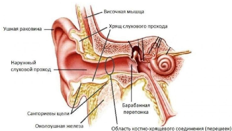
Рис. 2. Строение человеческого уха [9]