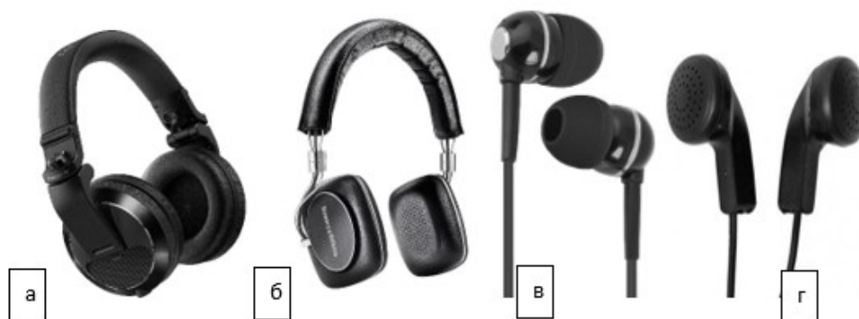
Рис. 4. Категории наушников: а – полноразмерные; б - накладные; в - вкладыши; г - внутриканальные

Все типы наушников можно разделить на четыре категории: полноразмерные наушники, накладные наушники, наушники-вкладыши и внутриканальные наушники (рис.4).